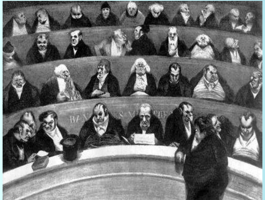
Оноре Домье «Законодательное чрево»