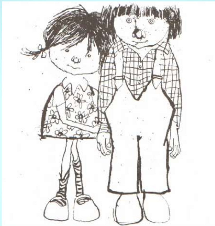
Карл Шредер Карикатурный шарж. 1955 г.